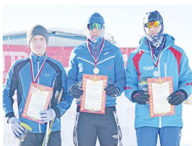
На пьедестале почёта мужчины 30-39 лет.