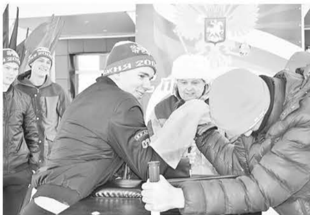
Борьба на руках.

испытания. Сначала капитаны доставляли каждого «бойца» к месту назначения, затем команды сразились в схватке, искали «мины» и обезвреживали их, брали в плен «языка», захватывали торпеду противника,