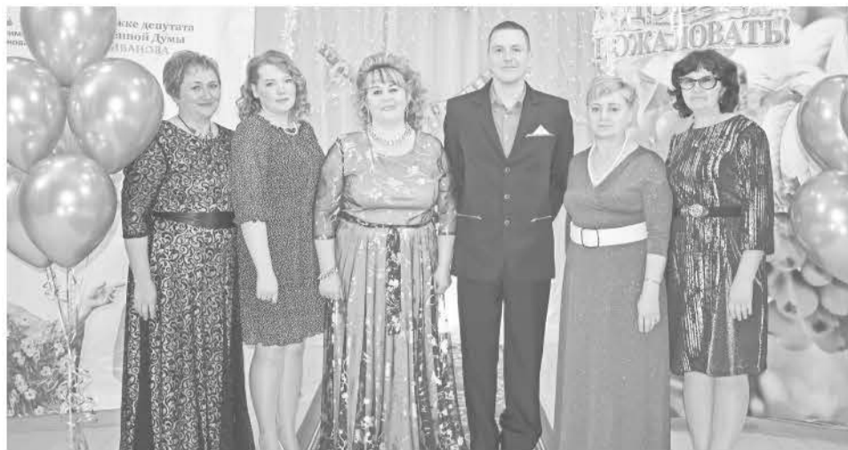
Творческий коллектив Вязовского Дома культуры.