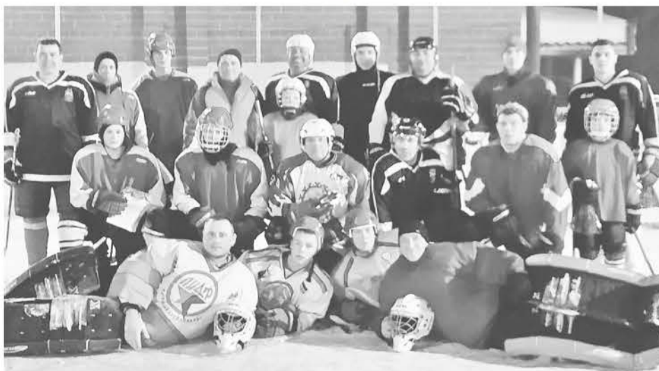
Товарищеский турнир завершился победой сборной Баженовского СП.

Накануне Дня защитника Отечества на корте в деревне Макушиной состоялся небольшой товарищеский турнир. На лёд вышли хозяева – сборная Баженовского сельского поселения – и наши друзья из Ирбита. Игра получилась упорной, зрелищной, волнительной для всех участников, держала в напряжении с первой до последней минуты. В хоккее по-другому не бывает. Активность проявляли болельщики. Поддерживали команды,