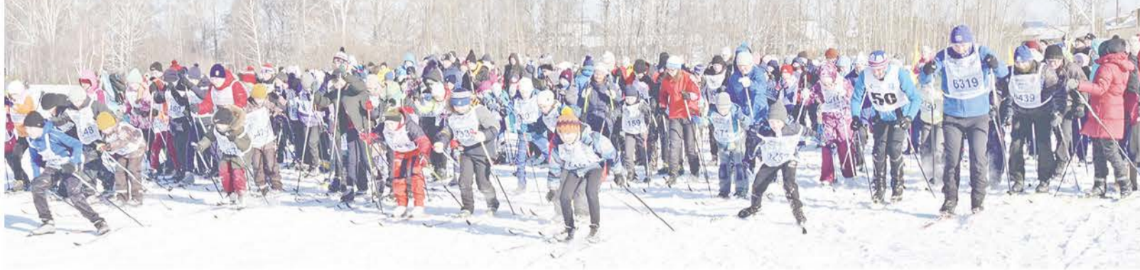
В гонке приняли участие 350 человек.

На протяжении нескольких десятилетий всероссийская массовая лыжная гонка «Лыжня России» объединяет поклонников одного из самых популярных и массовых видов спорта. У этого яркого, масштабного зимнего праздника славная история. В этом году гонка состоялась уже в сороковой раз.